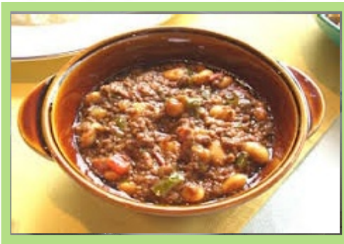
大豆のキーマカレー